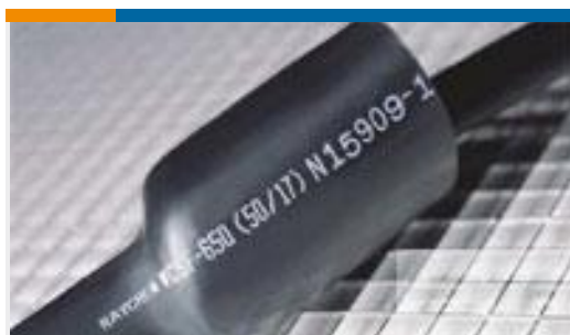
TE 产品编号D83008-000 WCSF-115-9/3-6N(B50)