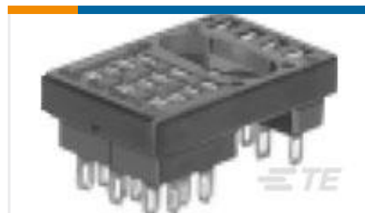
TE 产品编号1419111-5 24A071=CLIP,SKT,ASSY,W/SCW