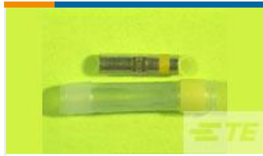
TE 产品编号650098-000 D-436-75