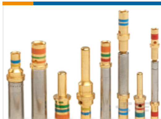
TE 产品编号ZPF000000000004365 81539-23