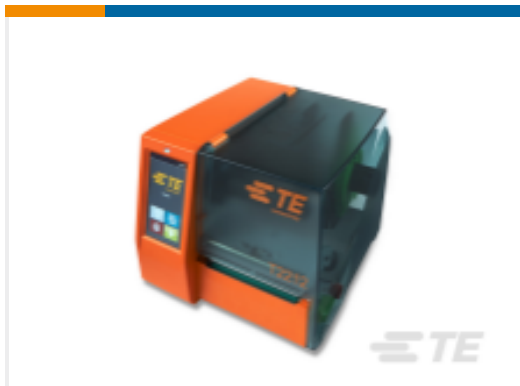
TE 产品编号1-2186527-1 T2212-PRINTER