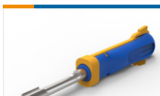
TE 产品编号91017-3 AMP-INCERT TAB EXTRACTION TOOL