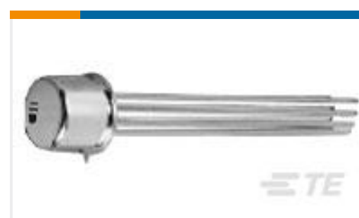
TE 产品编号1617125-6 JMAW-26XM = M39016/9-018M