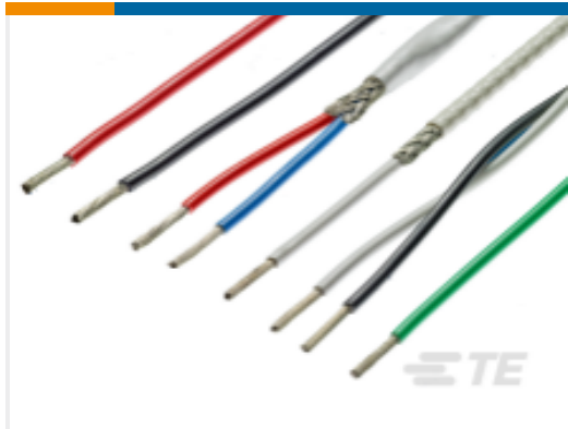
TE 产品编号2823013001 44A0211-8-9