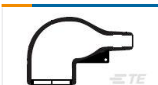
TE 产品编号812843-000 222K142-3-0