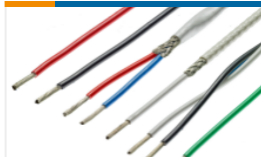
TE 产品编号3060913003 44AM1121-20-9/96-9