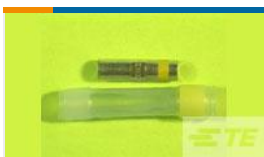
TE 产品编号 650075-000 D-436-37