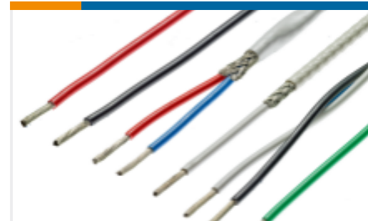
TE 产品编号3833573002 44A1121-22-9/96-9