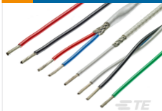
TE 产品编号3061943001 44AM1121-22-9/96-9