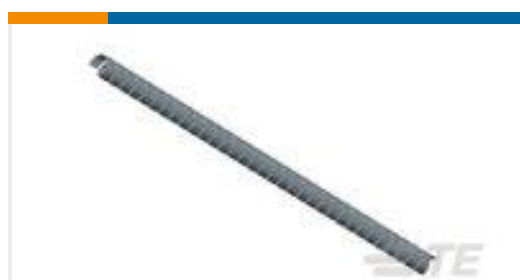
TE 产品编号142841-1 TUBING SPIRAP 500031-1