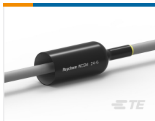
TE 产品编号EE0446-000 WCSM-24/6-225-S-(B50)