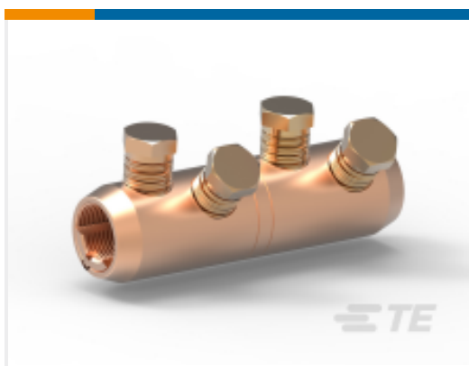
TE 产品编号1099879-1 CSBS-300C-750C