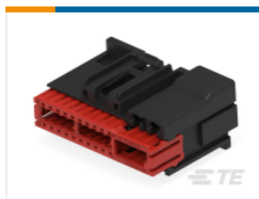
TE 产品编号2236269-2 24POS, MIXED,REC HSG, 20GENYMCP,ASSY,CODB