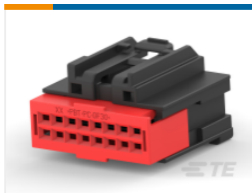
TE 产品编号1456989-1 2x8 Fem unsealed LP assy Key A