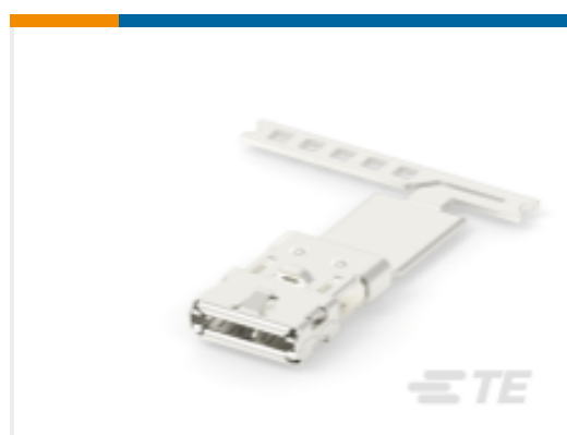
TE 产品编号2-2293004-3 MCON 12, AG CA, BLANK WF, S-S WF, 180