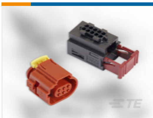
TE 产品编号936780-2 Timer Connector Housing