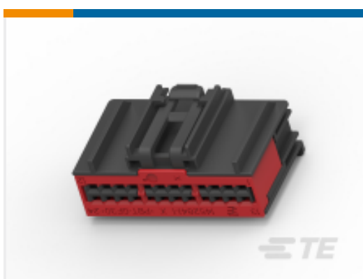
TE 产品编号1452839-5 24 POS FEMALE HSG ASSY