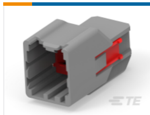
TE 产品编号1411169-4 GET;2X4POS. MALE CONNECTOR ASSY