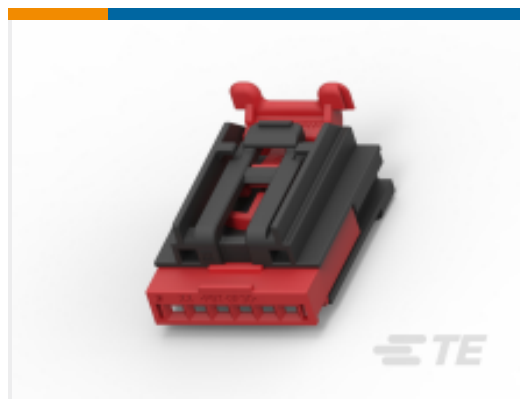
TE 产品编号1456985-2 1X6 Fem unsealed LP assy Key B w /CPA