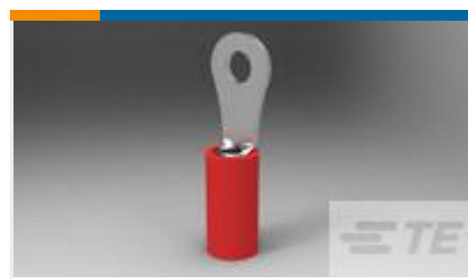
TE 产品编号2-330648-1 PIDG 22-16 22-18 MIL R 4; TAPE