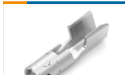
TE 产品编号2208669-3 8MM HV, CONTACT, ASSY