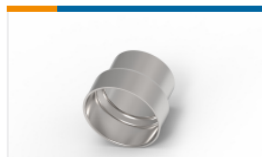
TE 产品编号2177090-3 STEEL, OUTER FERRULE, 8MM HV, 25SQMM