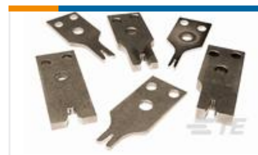
TE 产品编号1-1633961-2 CRIMPER, INSULATION F PREMIUM 25SQMM