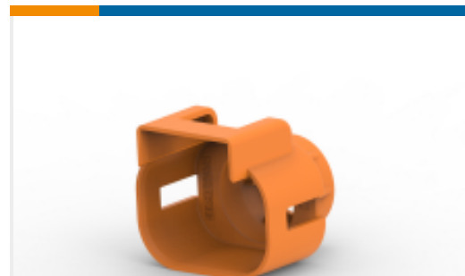
TE 产品编号2103013-3 CABLE SEAL RETAINER, SIZE 2, OR, HVA280