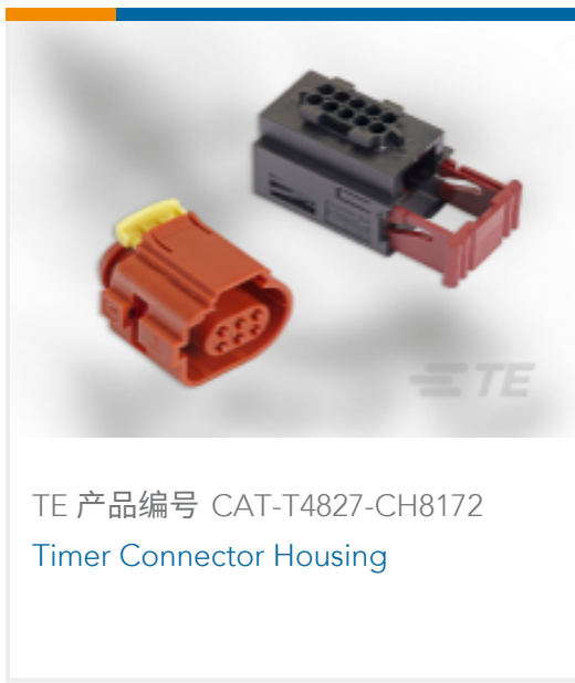
TE 产品编号 CAT-T4827-CH8172 Timer Connector Housing