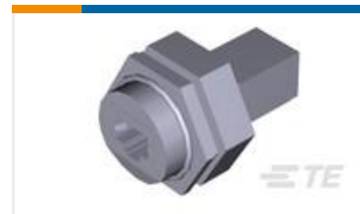
TE 产品编号1546413-3 ETHERNET RJ-45 BLKHD PASSTHRU