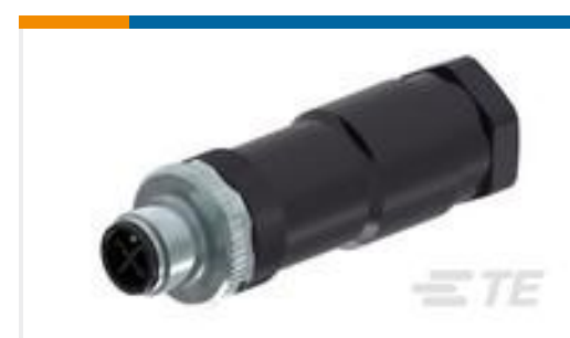
TE 产品编号2120951-1 M12 AC POWER CONNECTOR, S-CODED, PLUG