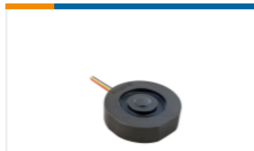
TE 产品编号20009605-64 FX29J0-100A-0050-L