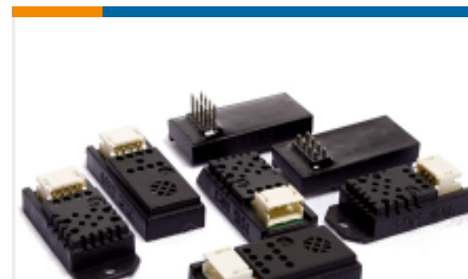
TE 产品编号HPP815A533 HTG3513CH GAS MEASURE SENSOR