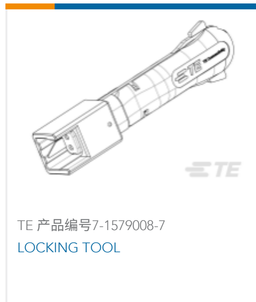
TE 产品编号7-1579008-7 LOCKING TOOL