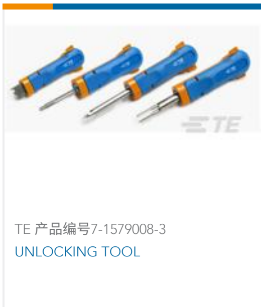
TE 产品编号7-1579008-3 UNLOCKING TOOL