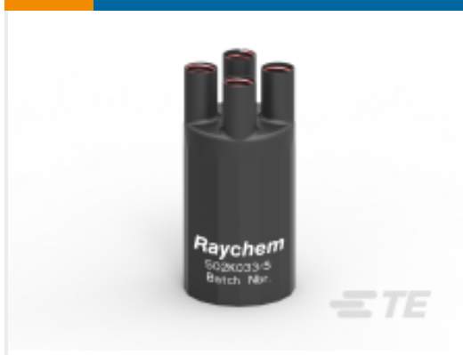
TE 产品编号E00553N001 502K033/S(S15)