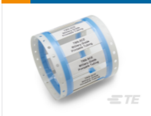
TE 产品编号245965-000 TMS-SCE Military Grade Sleeves