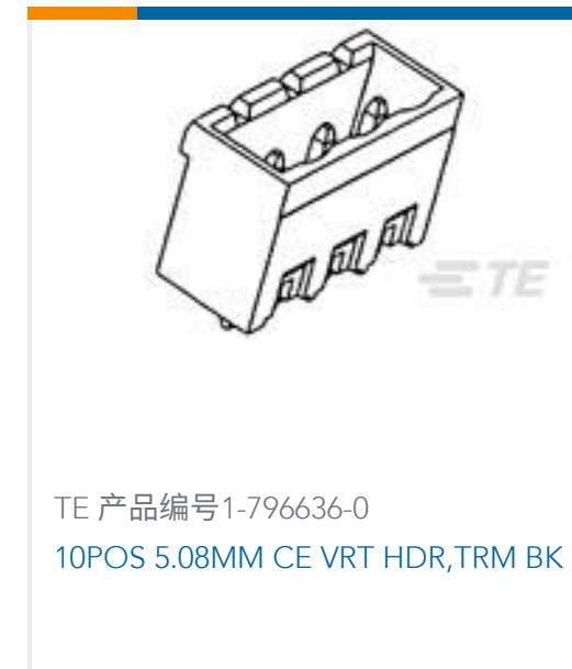
TE 产品编号1-796636-0 10POS 5.08MM CE VRT HDR, TRM BK