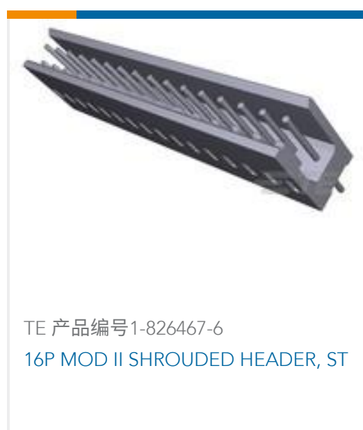
TE 产品编号1-826467-6 16P MOD II SHROUDED HEADER, ST