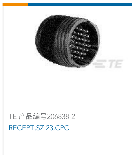
TE 产品编号206838-2 RECEPT, SZ 23, CPC