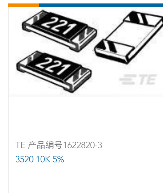
TE 产品编号1622820-3 3520 10K 5%