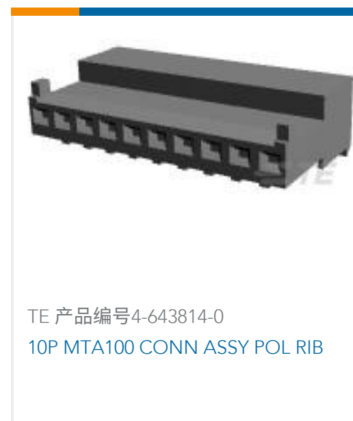
TE 产品编号4-643814-0 10P MTA100 CONN ASSY POL RIB