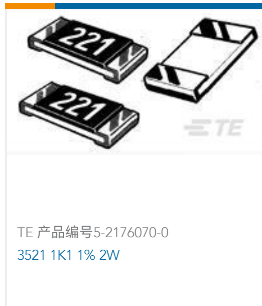
TE 产品编号5-2176070-0 3521 1K1 1% 2W