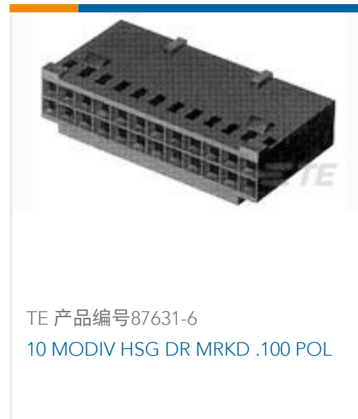
TE 产品编号87631-6 10 MODIV HSG DR MRKD .100 POL