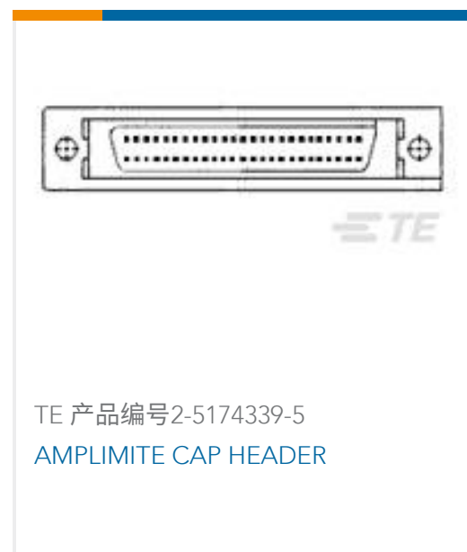
TE 产品编号2-5174339-5 AMPLIMITE CAP HEADER