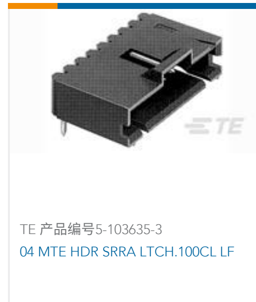
TE 产品编号5-103635-3 04 MTE HDR SRRRA LTCH.100CL LF