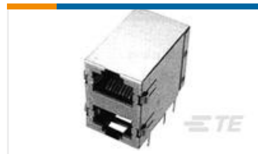
TE 产品编号5569381-1 STK MJ ASSY, 8POS, 2X1, SHLD, CAT5