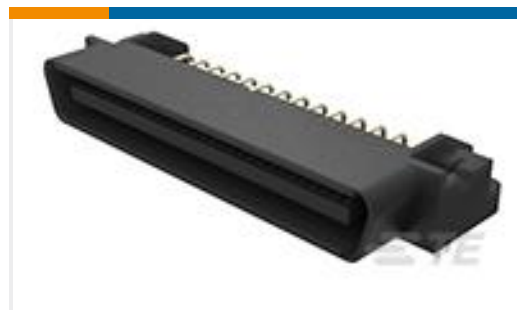
TE 产品编号1734099-7 Champ 050 series, plug assembly