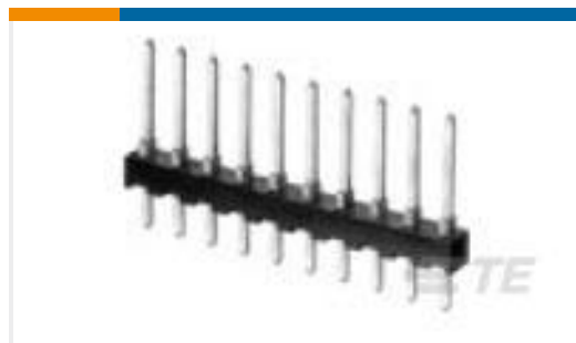
TE 产品编号87220-3 03 MODII HDR SRST UNSHRD .100