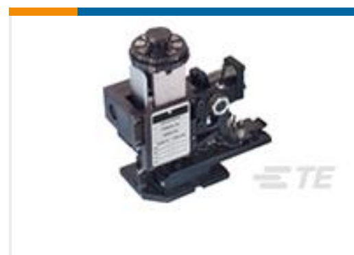
TE 产品编号1855674-2 END FEED HDM/FA 140F-AMPLIVAR SPLICE