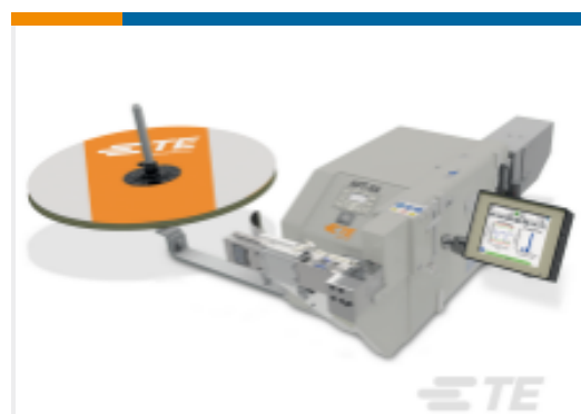
TE 产品编号1-2161800-0 APT-5A TERMINATING MACHINE