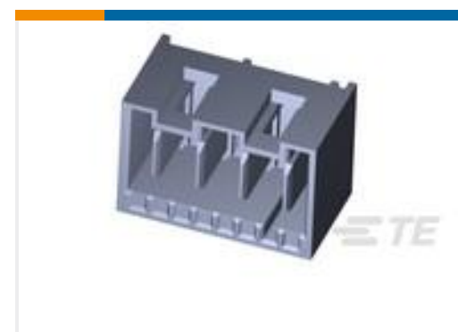
TE 产品编号2-1971895-4 4P, RAST 5 Tab Header, THV