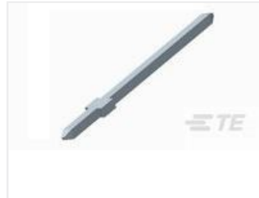
TE 产品编号1-928836-2 MOD2 PIN WITH A-PIN L/P