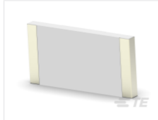
TE 产品编号7-2176246-6 CRGS2512 5% 1M8