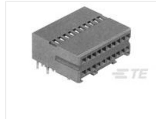
TE 产品编号5-103911-3 60 SYSTEM 50 RCPT ASSY DRRA