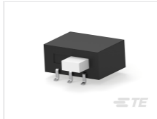
TE 产品编号1-1437581-1 ASE22RL=AUTOSLIDE DP