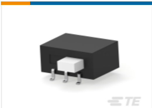
TE 产品编号1-1437581-1 ASE22RL=AUTOSLIDE DP 0.3W