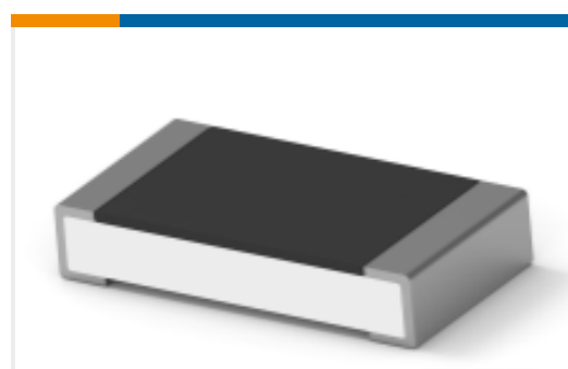
TE 产品编号4-2176391-7 RQ 1206 37K4 0.1% 10PPM 5K RL