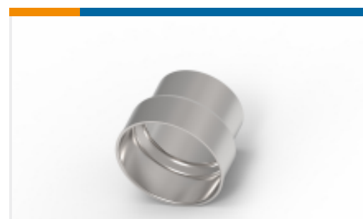
TE 产品编号2177090-3 STEEL, OUTER FERRULE, 8MM HV, 25SQMM