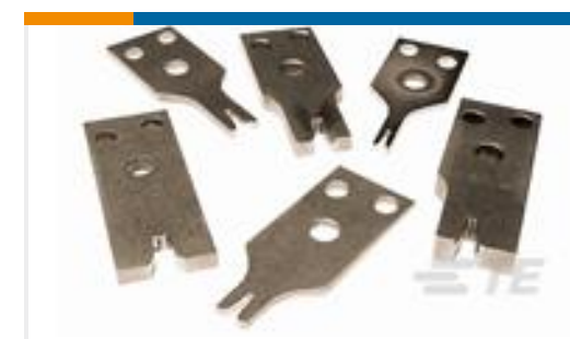
TE 产品编号1-1633961-2 CRIMPER, INSULATION F PREMIUM