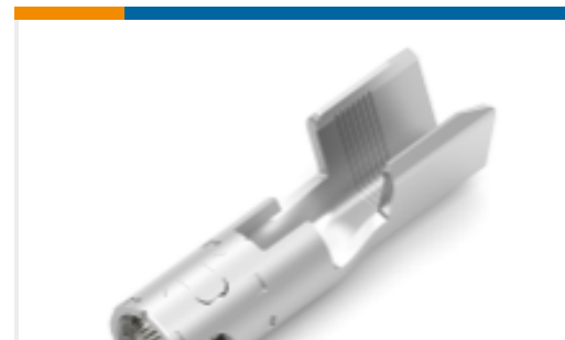
TE 产品编号2208669-3 8MM HV, CONTACT, ASSY