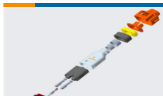
TE 产品编号YHV280-2PM-P-4MM-B HVA280-2phm, pass, 4sqmm, Key B