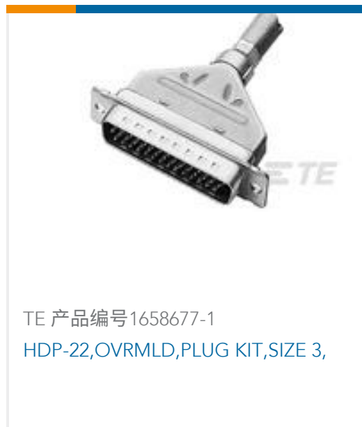
TE 产品编号1658677-1 HDP-22, OVRMLD, PLUG KIT, SIZE 3,