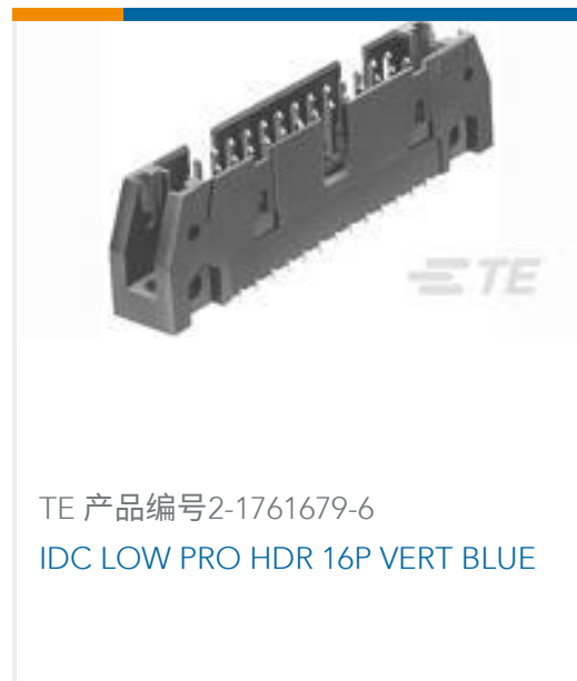
TE 产品编号2-1761679-6 IDC LOW PRO HDR 16P VERT BLUE