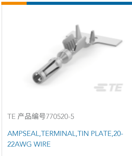
TE 产品编号770520-5 AMPSEAL, TERMINAL, TIN PLATE, 20-22AWG WIRE