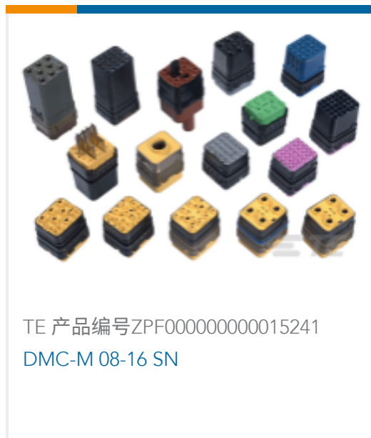
TE 产品编号ZPF000000000015241 DMC-M 08-16 SN