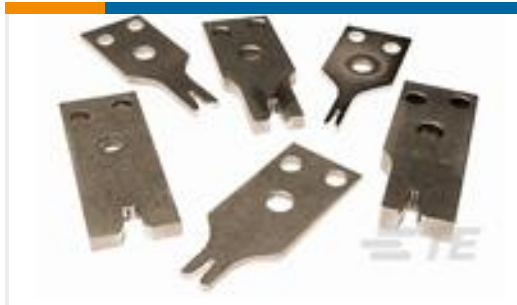
TE 产品编号1-913093-4 CRIMPER WIRE