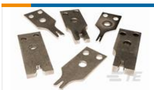
TE 产品编号937723-1 CRIMPER WIRE