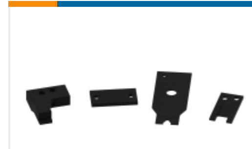
TE 产品编号752999-1 FRONT SHEAR PLATE