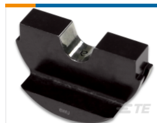
TE 产品编号1490413-2 HYP10 SOLIS HD 8AWG NEST