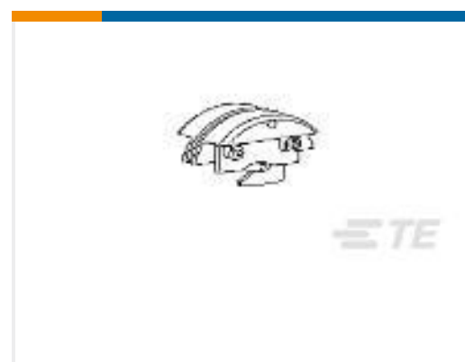
TE 产品编号1490414-2 HYP10 SOLIS HD 6-4AWG INDENTER