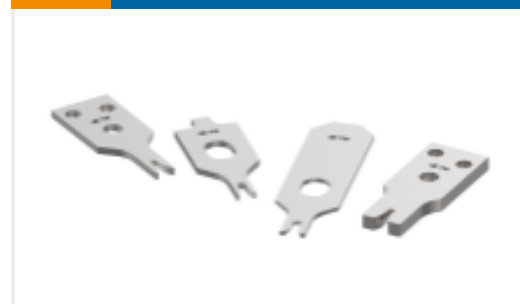
CRIMPER REPRESENTATION ONLY