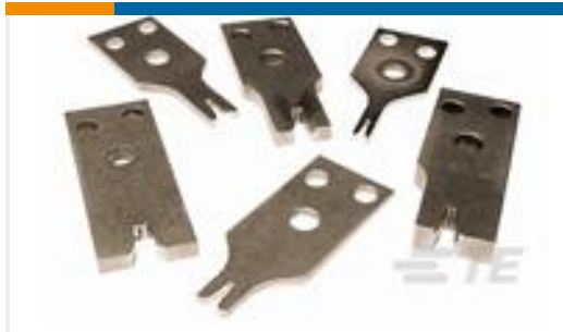
TE 产品编号2119582-9 Crimper, Insulation F Premium