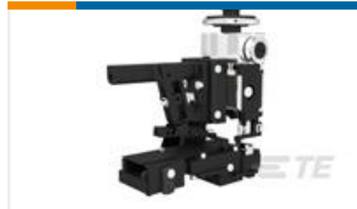
TE 产品编号2151072-1 OCEAN_2.0_APPLICATOR-S-055F108F-RSM