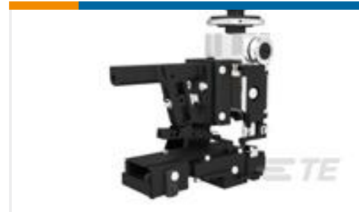
TE 产品编号2151074-1 OCEAN_2.0_APPLICATOR-S-080F130F-RSM