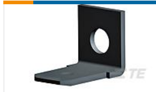
TE 产品编号63971-1 250 FASTON TAB TPBR