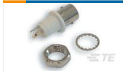
TE 产品编号1-1337452-0 BNC Ins BHSkt 50Ohm Nickel Gol