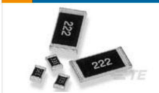
TE 产品编号7-1879494-3 CRGH0603 5% 1K0 0.2W