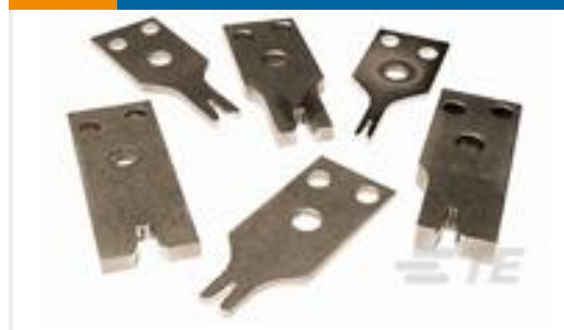
TE 产品编号4-456406-2 CRIMPER WIRE .090 \"F"