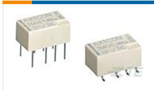
TE 产品编号1-1462037-4 IM03GR=IM RELAY 140mW 5V