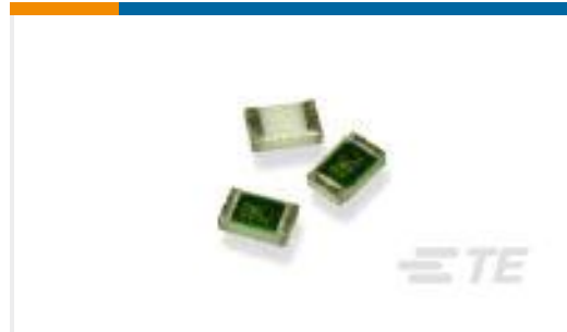
TE 产品编号1-1879215-5 CPF 0402 5K62 0.1% 25PPM 1K RL