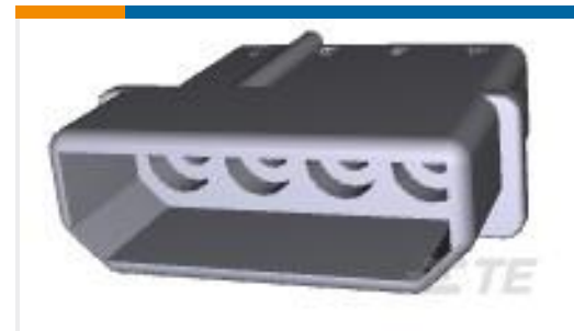
TE 产品编号1-480426-0 04P CMNL CAP HSG F/H NATL