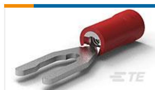
TE 产品编号52453 PG SPR SPD 22-16COMM22-18MIL 6