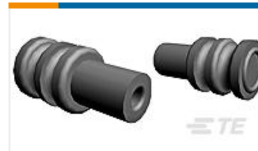
TE 产品编号964972-1 EINZELLEITERDICHTNG