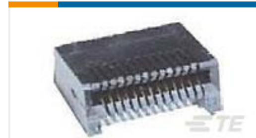
TE 产品编号1761987-7 Recept Conn Assm Right Angle 26P