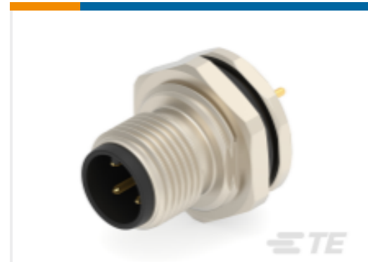
TE 产品编号T4140012041-000 M12, REAR MOUNTING, MALE, A CODE, 4P