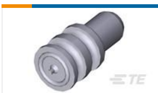
TE 产品编号963531-1 BLINDSTOPFEN