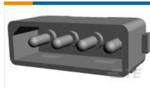
TE 产品编号350211-1 04P CMNL HDR ASSY PC