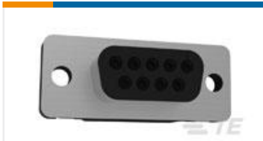
TE 产品编号1658612-4 09 POS HDF RCPT, MS, LEAD FREE