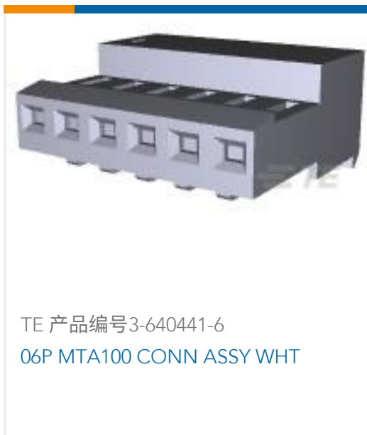
TE 产品编号3-640441-6 06P MTA100 CONN ASSY WHT