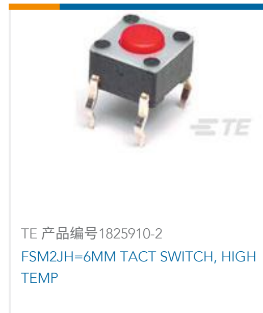
TE 产品编号1825910-2 FSM2JH=6MM TACT SWITCH, HIGH TEMP