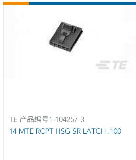
TE 产品编号1-104257-3 14 MTE RCPT HSG SR LATCH .100