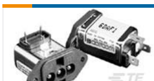
TE 产品编号6609075-7 10DAFP=F7983 S0