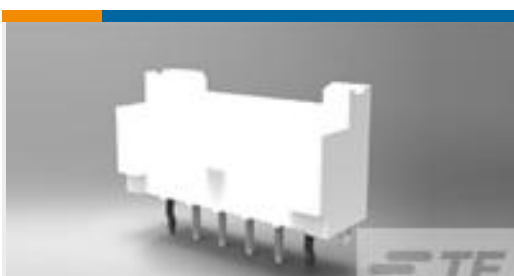
TE 产品编号1-1744418-6 16 POS EP 2.5 HDR, GLOW WIRE