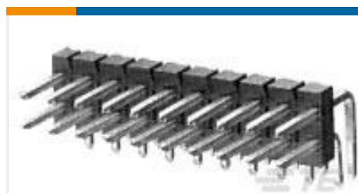
TE 产品编号5-103330-2 04 MODII HDR DRRR B/A .100 CL LF