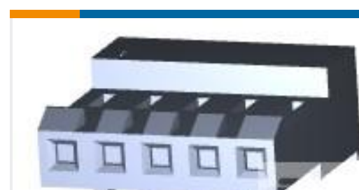
TE 产品编号3-641149-5 05P MTA156 ASSY 20AWG YEL LF