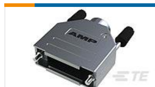
TE 产品编号1-1478762-5 METAL BACKSHELL 15 WAY TOP E