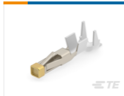
TE 产品编号2-2834067-3 SOCKET CONTACT,MINIATURE WATERPROOF CONN