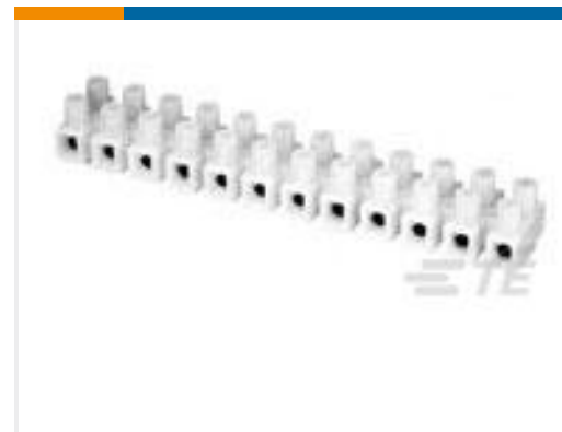
TE 产品编号1776296-3 TSB5000331DS=EUROPA T-BLK,10MM