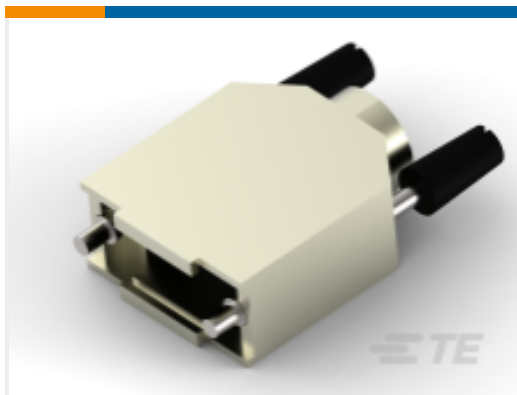
TE 产品编号5-1478762-1 Metal backshell 9 way Top Entry-KIT