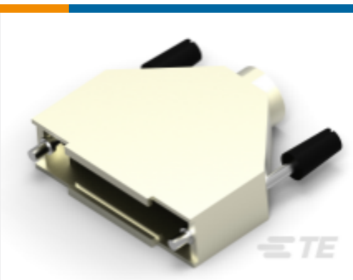
TE 产品编号5-1478762-3 Metal backshell 25 way Top Ent