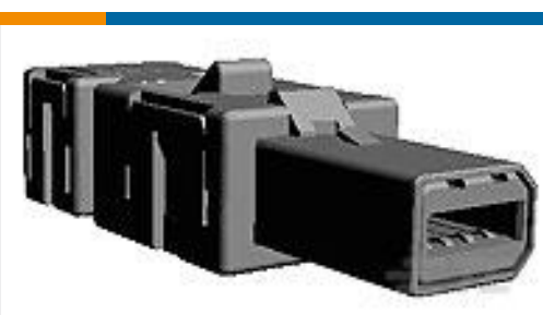
TE 产品编号2013595-1 INDUSTRIAL MINI I/O PLUG KIT D1