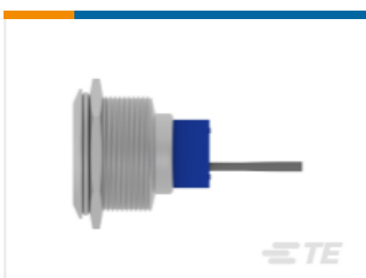
TE 产品编号2317655-1 AV25 SPM 3A NO LED FL