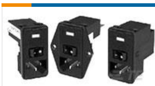
TE 产品编号5-6609107-4 PS0SXDS3A=C1111