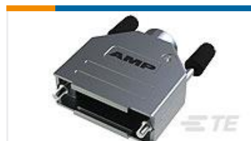
TE 产品编号5-1478762-2 Metal backshell 15 way Top Entry-KIT