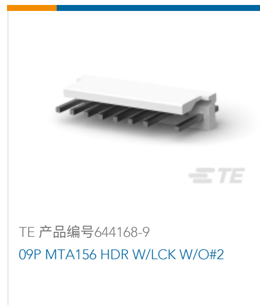
TE 产品编号644168-9 09P MTA156 HDR W/LCK W/O#2