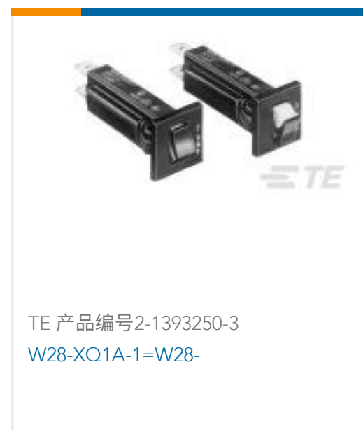
TE 产品编号2-1393250-3 W28-XQ1A-1=W28-