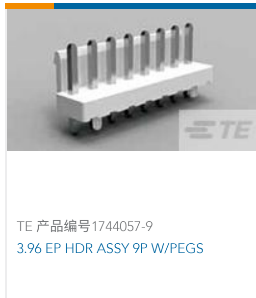
TE 产品编号1744057-9 3.96 EP HDR ASSY 9P W/PEGS