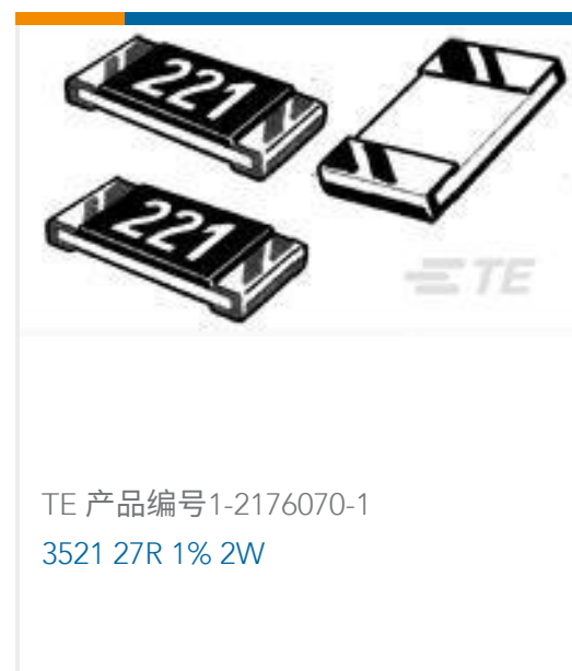
TE 产品编号1-2176070-1 3521 27R 1% 2W