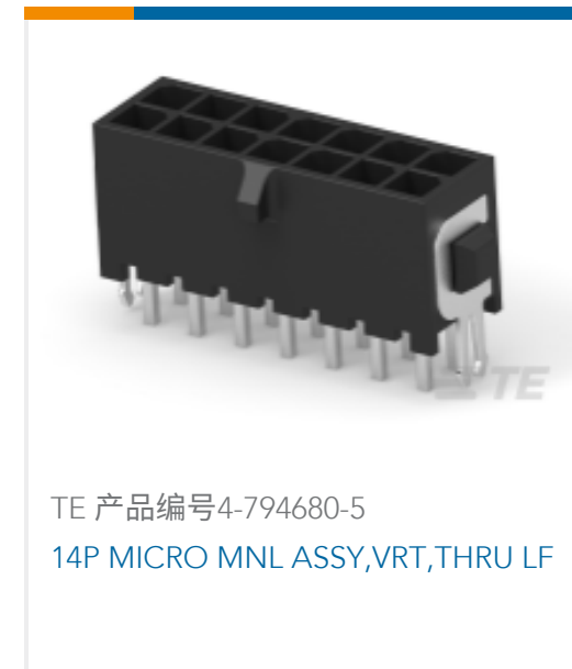
TE 产品编号4-794680-5 14P MICRO MNL ASSY,VRT,THRU LF