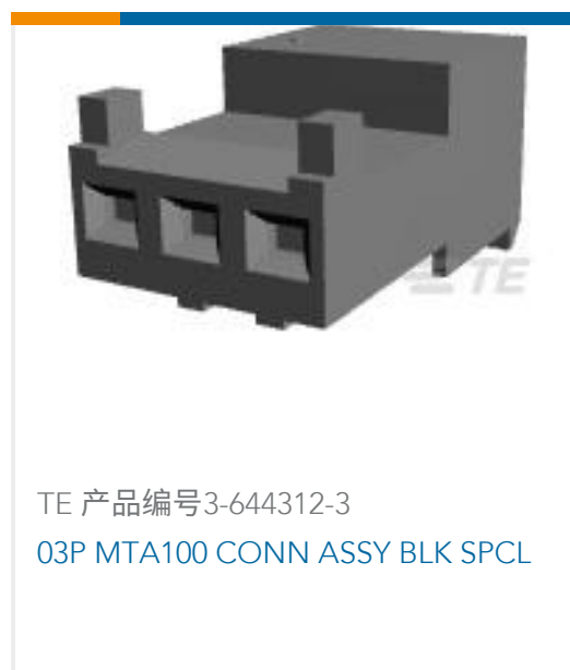
TE 产品编号3-644312-3 03P MTA100 CONN ASSY BLK SPCL