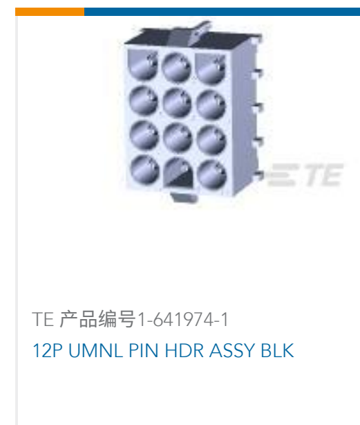
TE 产品编号1-641974-1 12P UMNL PIN HDR ASSY BLK