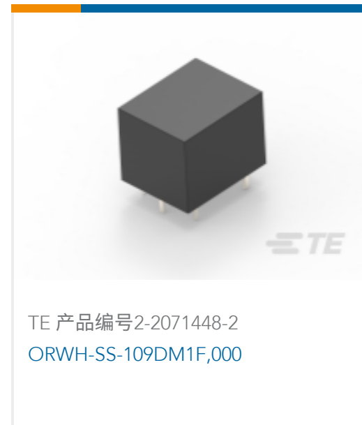
TE 产品编号2-2071448-2 ORWH-SS-109DM1F,000