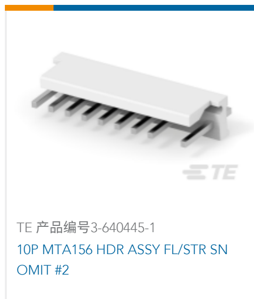
TE 产品编号3-640445-1 10P MTA156 HDR ASSY FL/STR SN OMIT #2