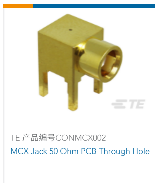
TE 产品编号CONMCX002 MCX Jack 50 Ohm PCB Through Hole