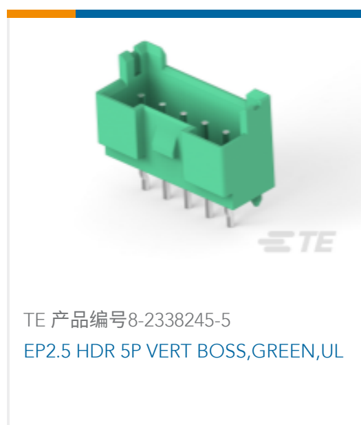
TE 产品编号8-2338245-5 EP2.5 HDR 5P VERT BOSS, GREEN, UL