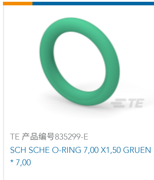
TE 产品编号835299-E SCH SCHE O-RING 7,00 X1,50 GRUEN * 7,00