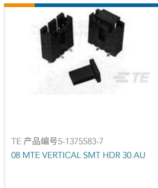
TE 产品编号5-1375583-7 08 MTE VERTICAL SMT HDR 30 AU