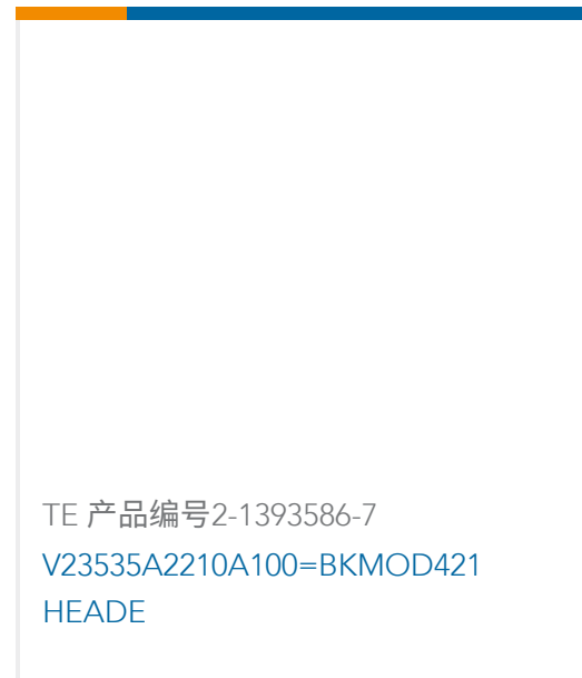
TE 产品编号2-1393586-7 V23535A2210A100=BKMOD421 HEADE