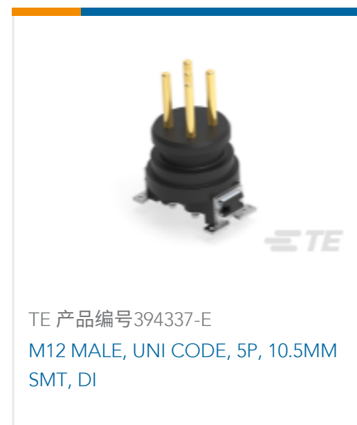
TE 产品编号394337-E M12 MALE, UNI CODE, 5P, 10.5MM SMT, DI