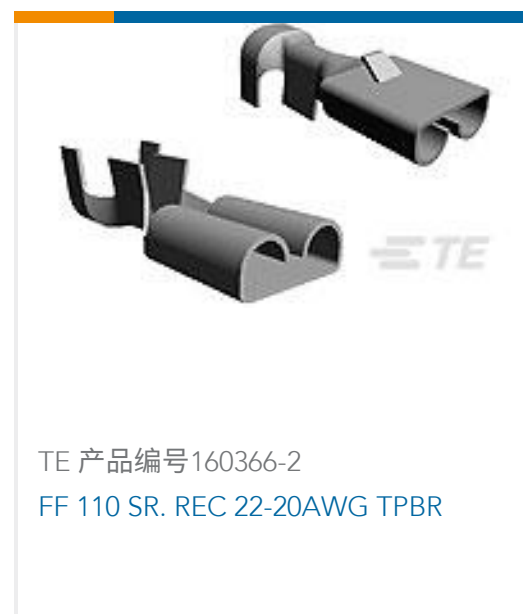
TE 产品编号160366-2 FF 110 SR. REC 22-20AWG TPBR