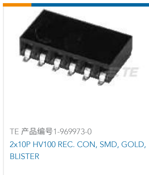
TE 产品编号1-969973-0 2x10P HV100 REC. CON, SMD, GOLD, BLISTER