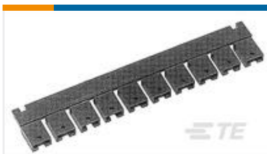
TE 产品编号382811-8 SHUNT, ECON, PHBR 5AU, BLACK