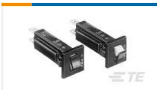
TE 产品编号3-1393250-2 W28-QX1A-2=W28-