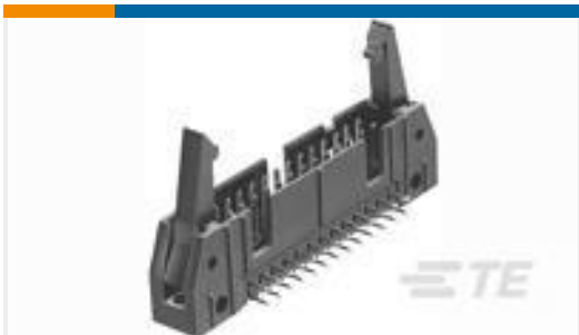
TE 产品编号5499786-3 A/L UNIV HDR 16P RA LG LAT