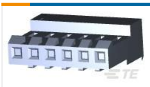
TE 产品编号3-640426-6 06P MTA156 CONN ASSY 18AWG ORA