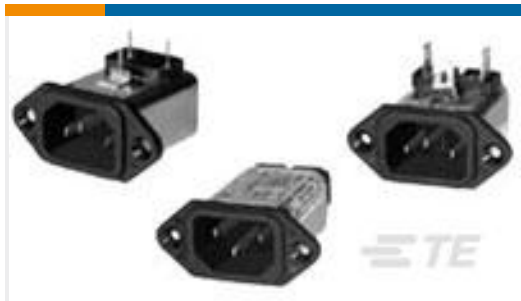
TE 产品编号6609000-7 6EEA1=F7116 S0