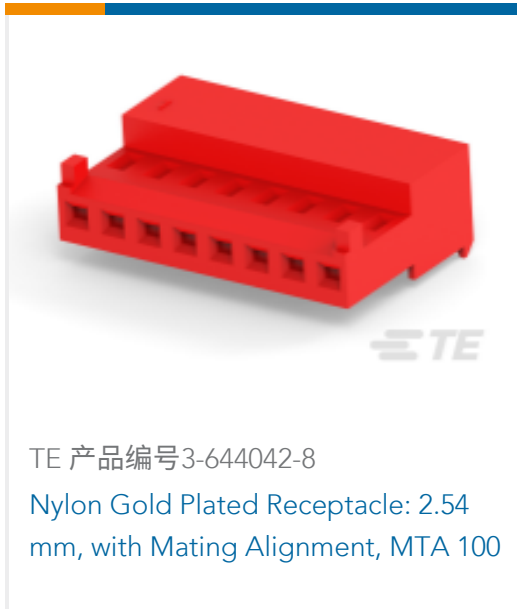
TE 产品编号3-644042-8 Nylon Gold Plated Receptacle: 2.54 mm, with Mating Alignment, MTA 100