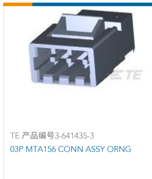
TE 产品编号3-641435-3 03P MTA156 CONN ASSY ORNG