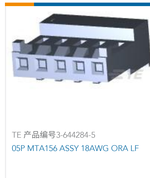
TE 产品编号3-644284-5 05P MTA156 ASSY 18AWG ORA LF