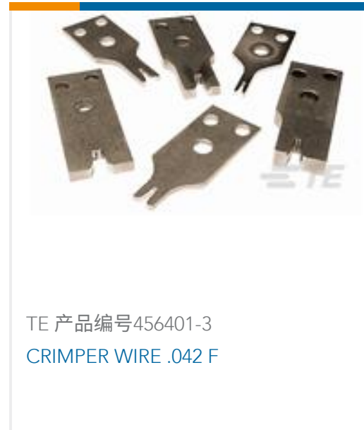
TE 产品编号456401-3 CRIMPER WIRE .042 F