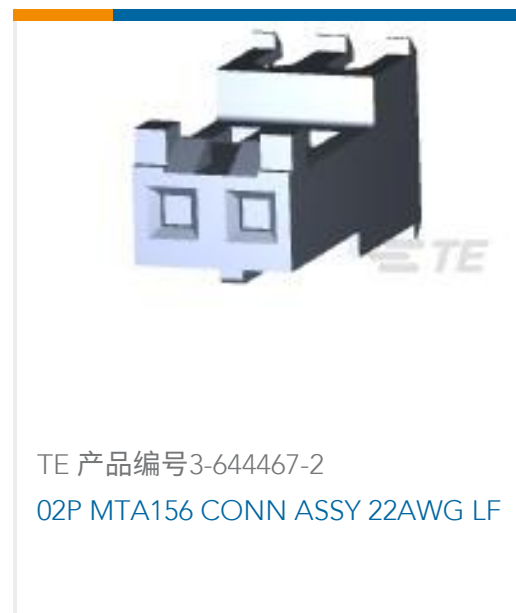
TE 产品编号3-644467-2 02P MTA156 CONN ASSY 22AWG LF