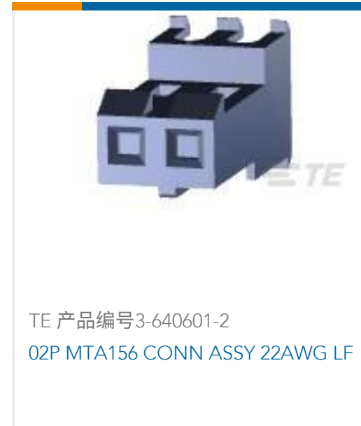
TE 产品编号3-640601-2 02P MTA156 CONN ASSY 22AWG LF