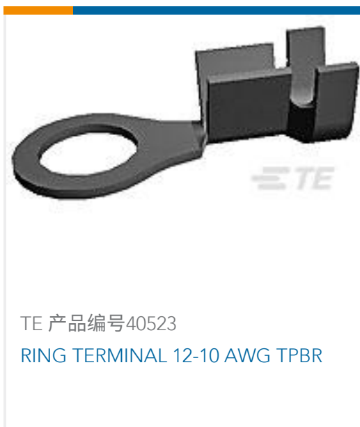
TE 产品编号40523 RING TERMINAL 12-10 AWG TPBR