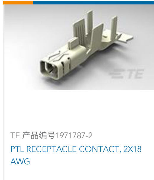
TE 产品编号1971787-2 PTL RECEPTACLE CONTACT, 2X18 AWG