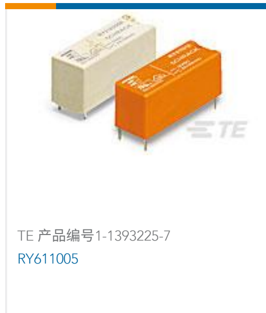
TE 产品编号1-1393225-7 RY611005