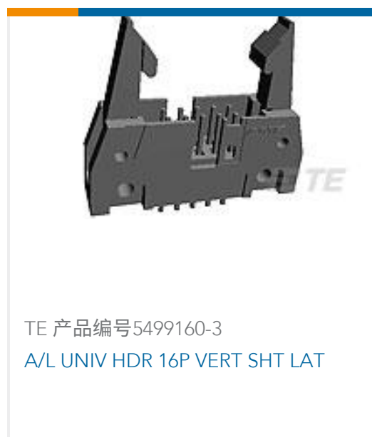
TE 产品编号5499160-3 A/L UNIV HDR 16P VERT SHT LAT