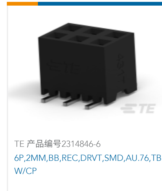
TE 产品编号2314846-6 6P,2MM,BB,REC,DRV,T,SMD,AU.76,TB,W/CP