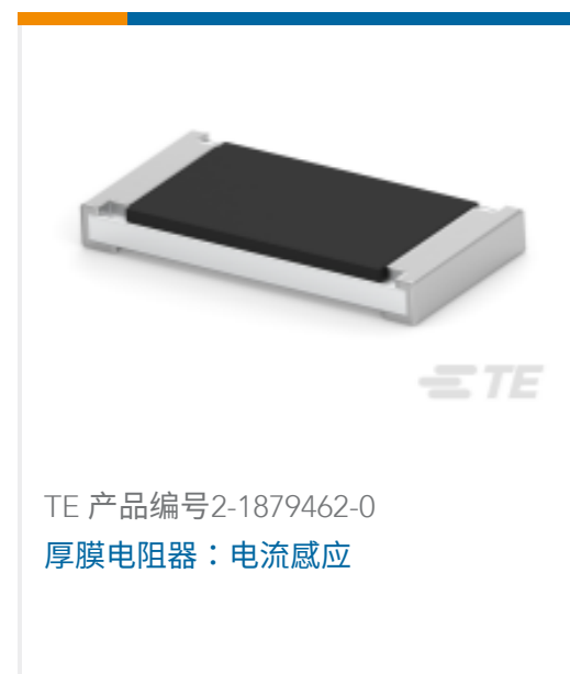
TE 产品编号2-1879462-0 厚膜电阻器：电流感应