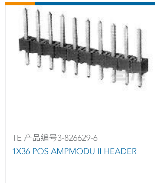
TE 产品编号3-826629-6 1X36 POS AMPMODU II HEADER