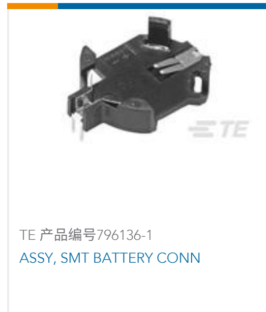
TE 产品编号796136-1 ASSY, SMT BATTERY CONN