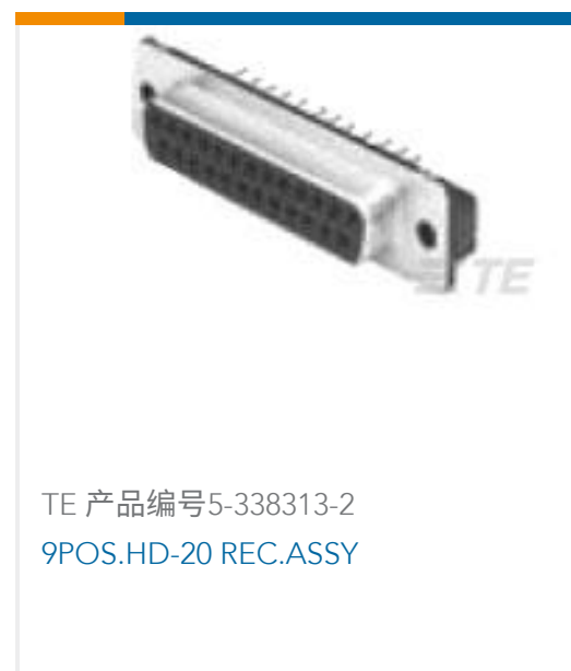
TE 产品编号5-338313-2 9POS.HD-20 REC.ASSY