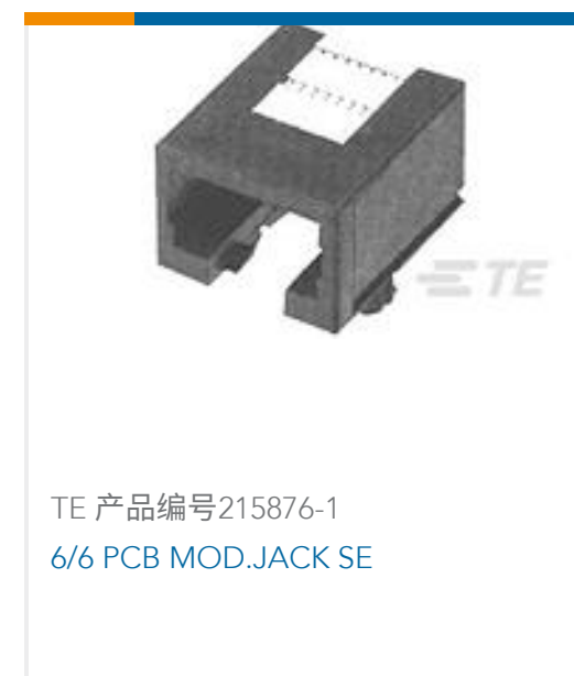
TE 产品编号215876-1 6/6 PCB MOD.JACK SE