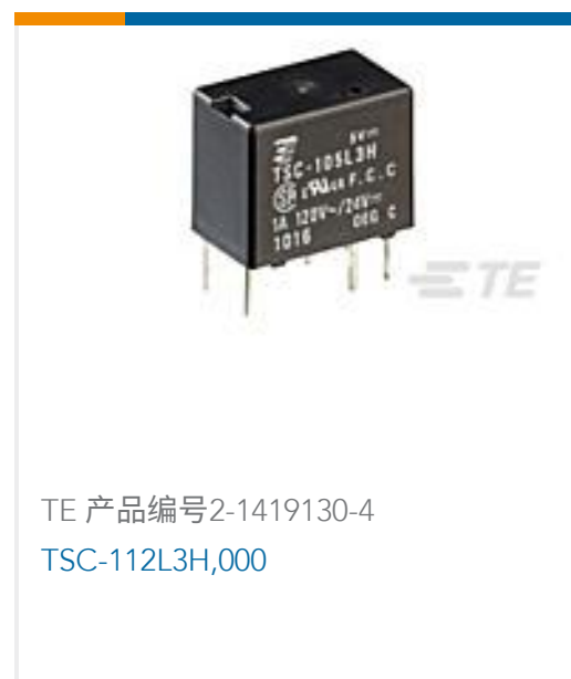
TE 产品编号2-1419130-4 TSC-112L3H,000