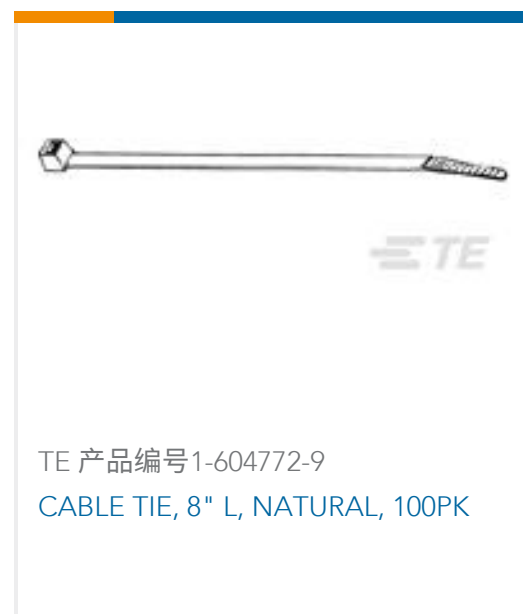
TE 产品编号1-604772-9 CABLE TIE, 8" L, NATURAL, 100PK