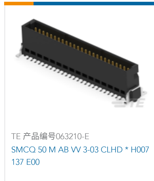
TE 产品编号063210-E SMCQ 50 M AB VV 3-03 CLHD * H007 137 E00