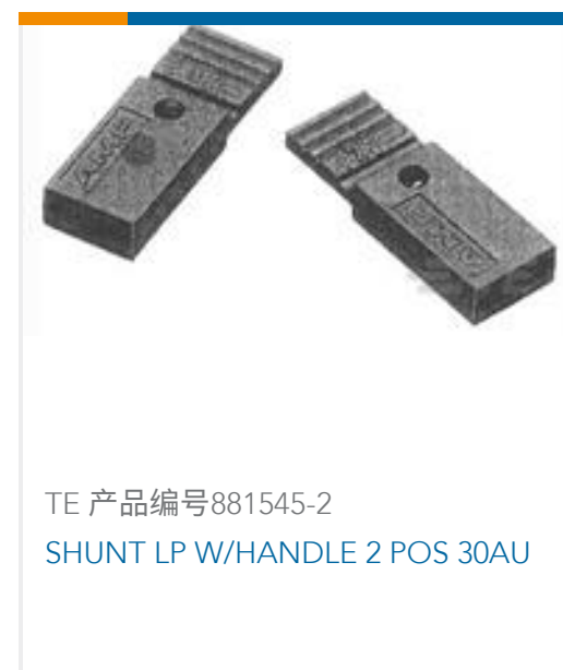
TE 产品编号881545-2 SHUNT LP W/HANDLE 2 POS 30AU