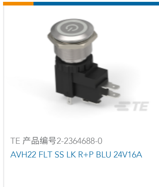
TE 产品编号2-2364688-0 AVH22 FLT SS LK R+P BLU 24V16A