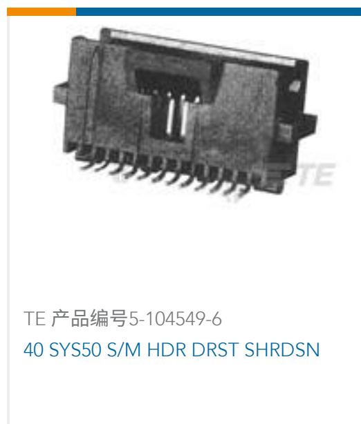
TE 产品编号5-104549-6 40 SYS50 S/M HDR DRST SHRDSN