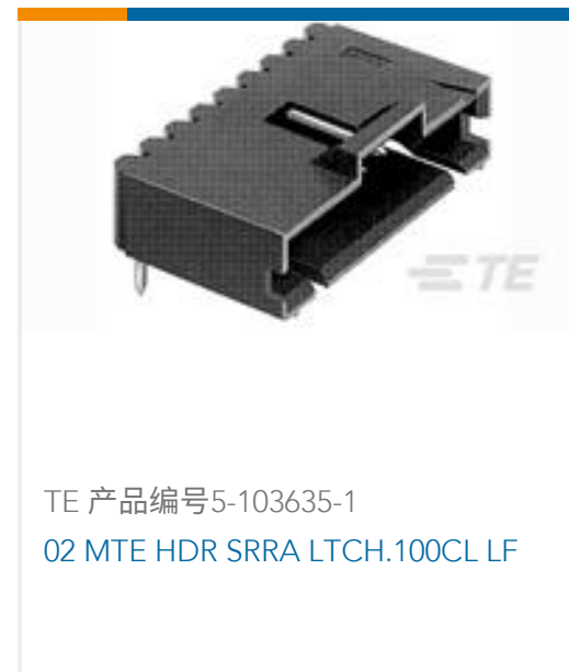
TE 产品编号5-103635-1 02 MTE HDR SRRR LTCH.100CL LF