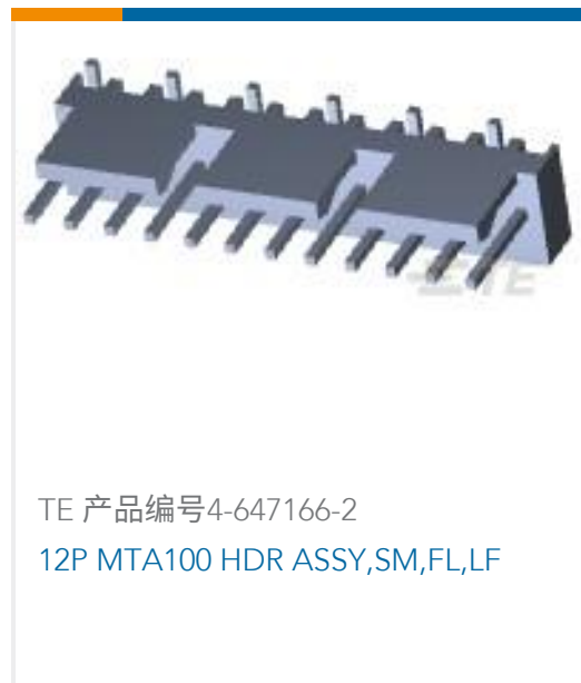
TE 产品编号4-647166-2 12P MTA100 HDR ASSY,SM,FL,LF