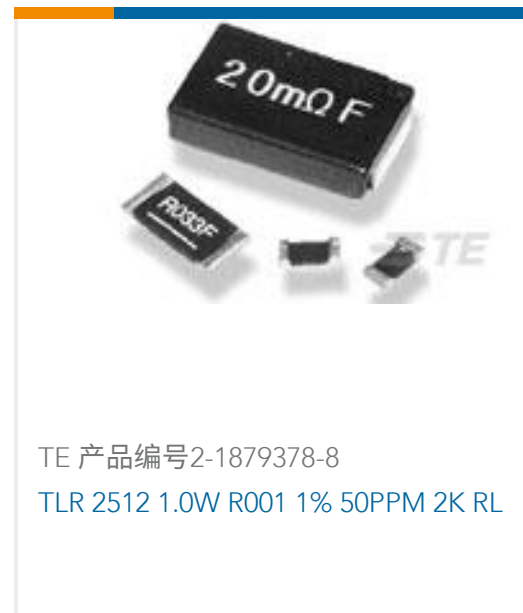
TE 产品编号2-1879378-8 TLR 2512 1.0W R001 1% 50PPM 2K RL