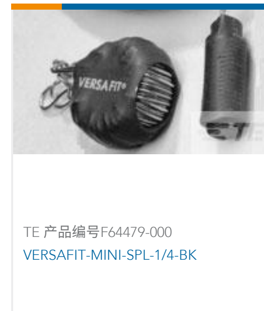
TE 产品编号F64479-000 VERSAFIT-MINI-SPL-1/4-BK