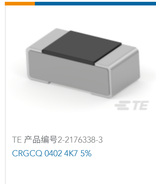
TE 产品编号2-2176338-3 CRGCQ 0402 4K7 5%