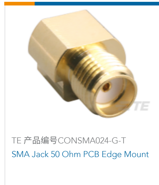
TE 产品编号CONSMA024-G-T SMA Jack 50 Ohm PCB Edge Mount