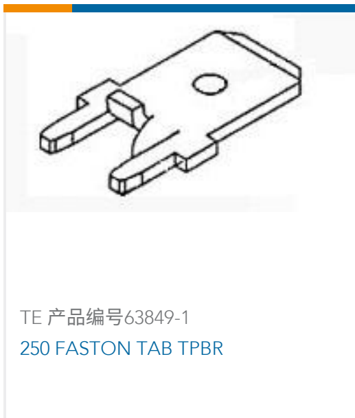
TE 产品编号63849-1 250 FASTON TAB TPBR