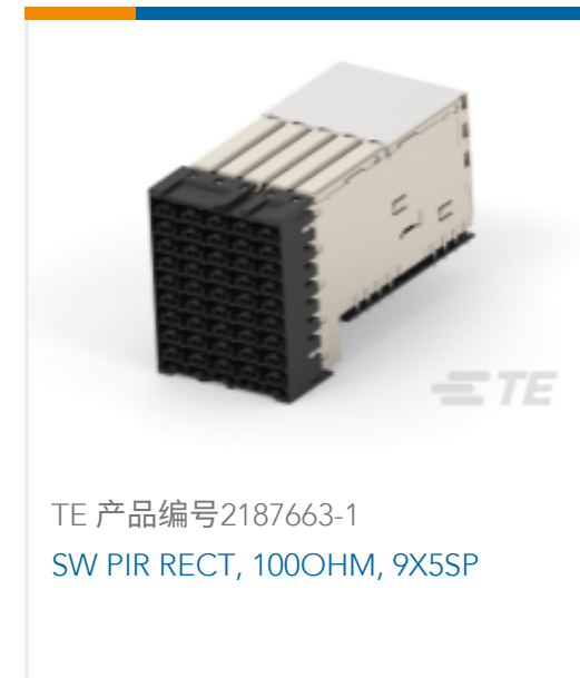
TE 产品编号2187663-1 SW PIR RECT, 100OHM, 9X5SP