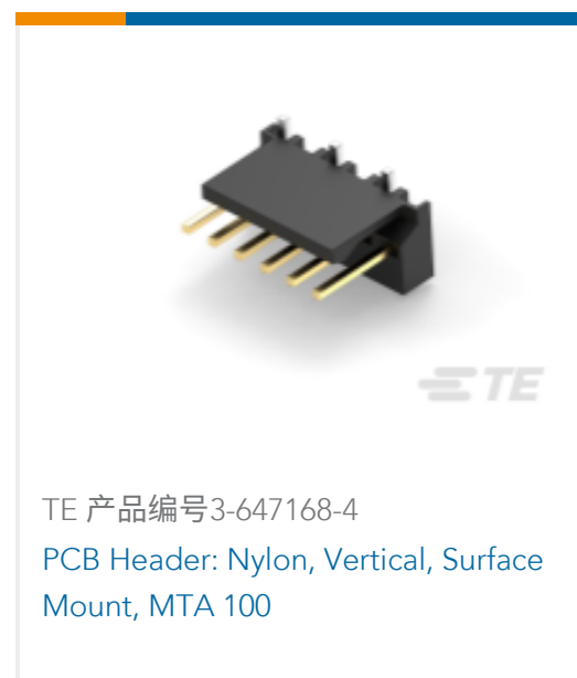
TE 产品编号3-647168-4 PCB Header: Nylon, Vertical, Surface Mount, MTA 100