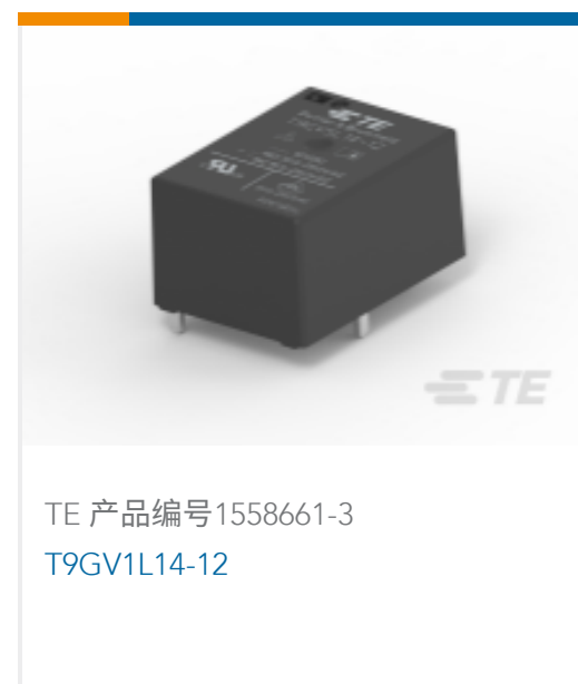
TE 产品编号1558661-3 T9GV1L14-12