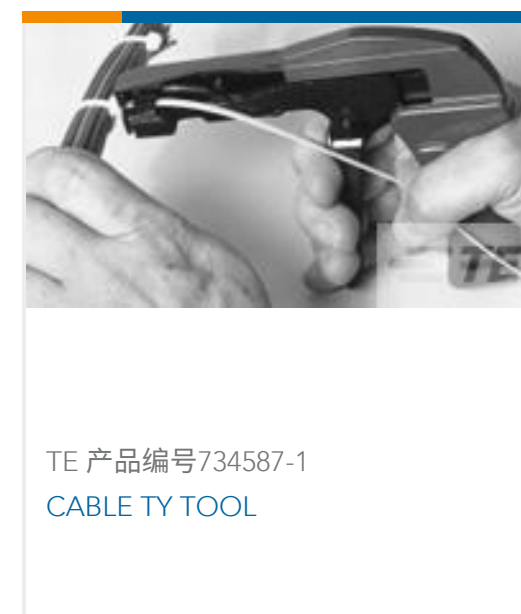
TE 产品编号734587-1 CABLE TY TOOL