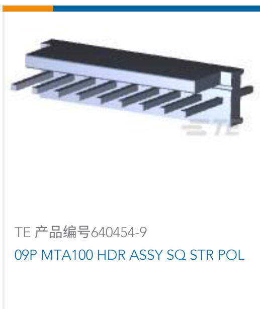
TE 产品编号640454-9 09P MTA100 HDR ASSY SQ STR POL