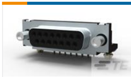
TE 产品编号5747845-6 15 MSFL RCPT RA 318 (SL,FM,BL)