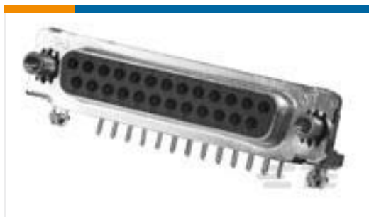
TE 产品编号5747847-6 37 MSFL RCPT RA 318 (SL,FM,BL)