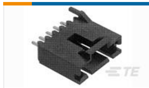
TE 产品编号5-104809-4 05 MTE HDR SRST LATCH W/HLDWN