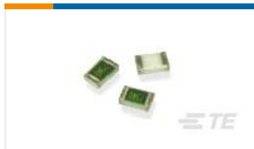
TE 产品编号7-1879133-3 RN 0603 4K99 0.1% 10PPM 1K RL