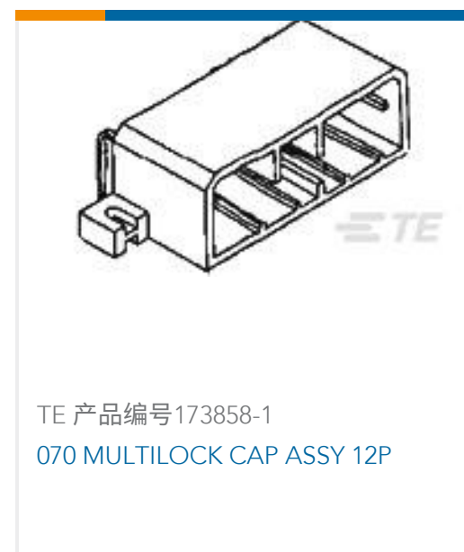
TE 产品编号173858-1 070 MULTILOCK CAP ASSY 12P