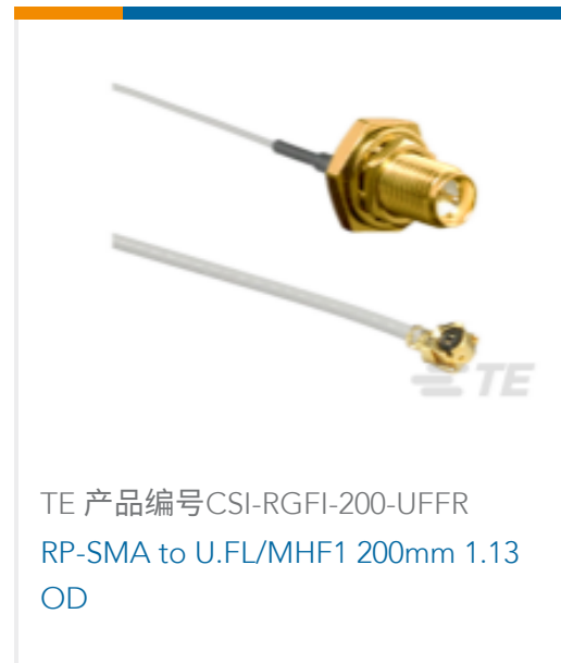
TE 产品编号CSI-RGFI-200-UFFR RP-SMA to U.FL/MHF1 200mm 1.13 OD