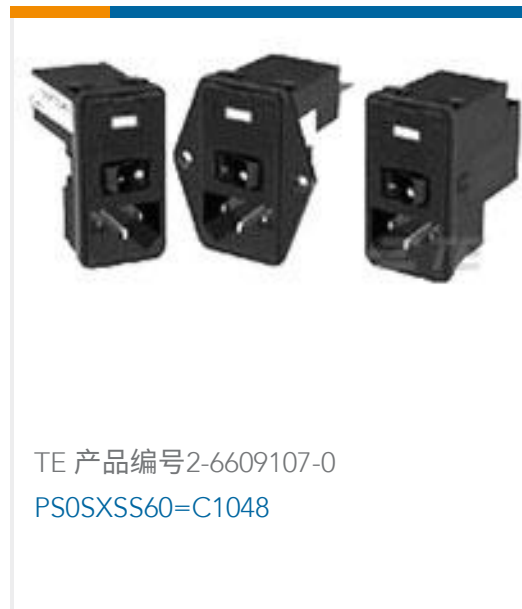
TE 产品编号2-6609107-0 PS0SXSS60=C1048