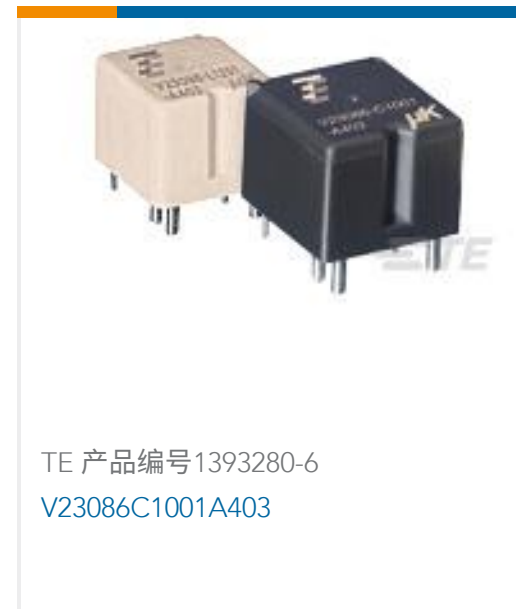
TE 产品编号1393280-6 V23086C1001A403