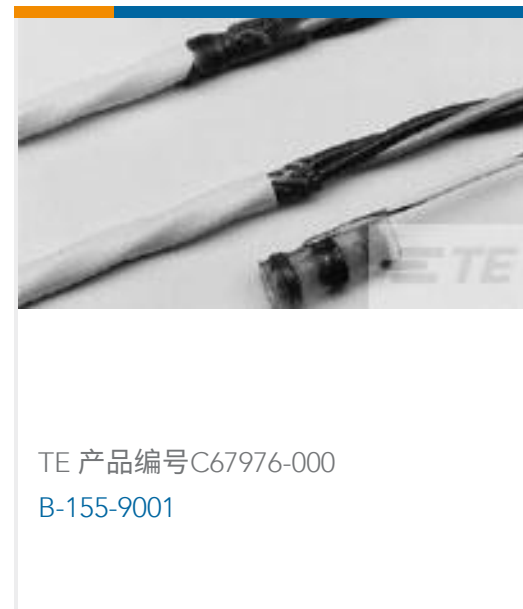
TE 产品编号C67976-000 B-155-9001