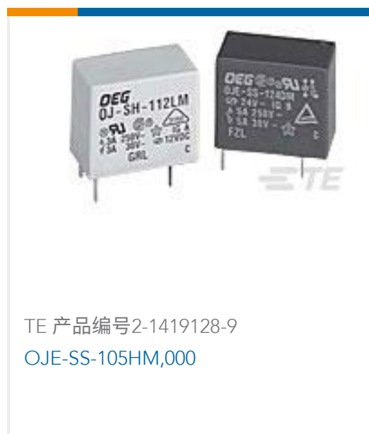
TE 产品编号2-1419128-9 OJE-SS-105HM,000