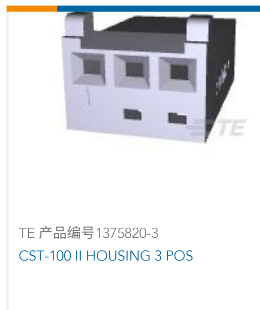
TE 产品编号1375820-3 CST-100 II HOUSING 3 POS