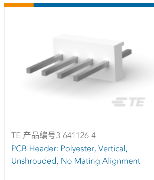
TE 产品编号3-641126-4 PCB Header: Polyester, Vertical, Unshrouded, No Mating Alignment