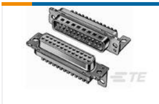
TE 产品编号3-1393480-2 V23529B1122C209=SUB D STIFTLEI