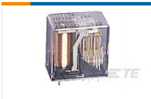
TE 产品编号3-1393808-6 V23154D 712F104