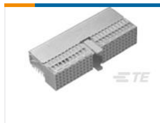
TE 产品编号5100147-1 Z-PACK/A RAF 110P