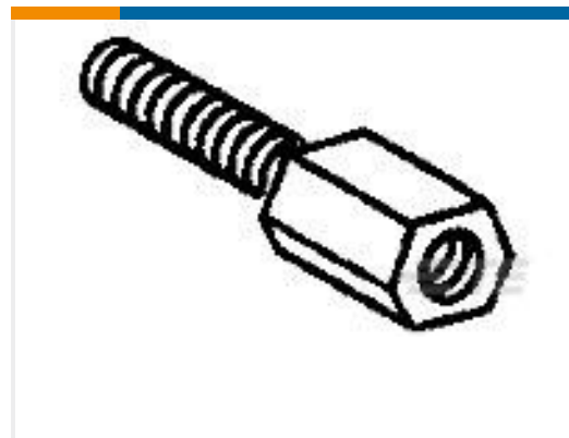
TE 产品编号828102-1 HD-20SCHRAUB-SICHRG