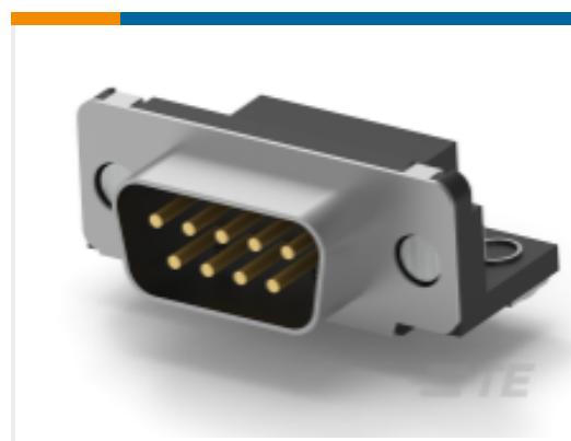
TE 产品编号5747250-4 D-Sub 插头组件：标准，直角，外壳尺寸 1，2.74mm