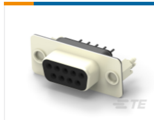
TE 产品编号2301838-1 AMPL REC HD20, VERT, 9P, B/L, 4-40 INS