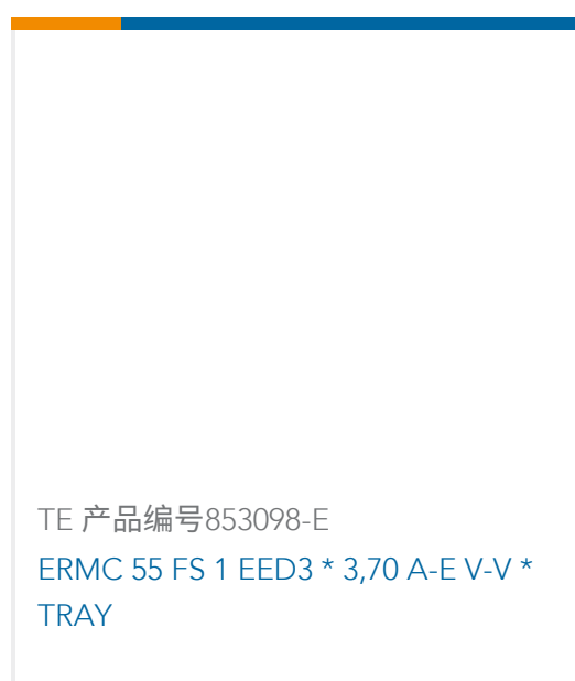
TE 产品编号853098-E ERMCM 55 FS 1 EED3 * 3,70 A-E V-V * TRAY