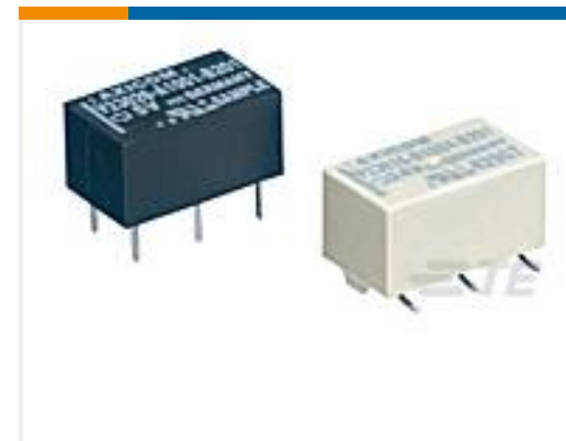
TE 产品编号1393776-3 V23026D1021B201 *X020