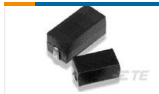
TE 产品编号8-1879233-9 SMW5 470R 5%