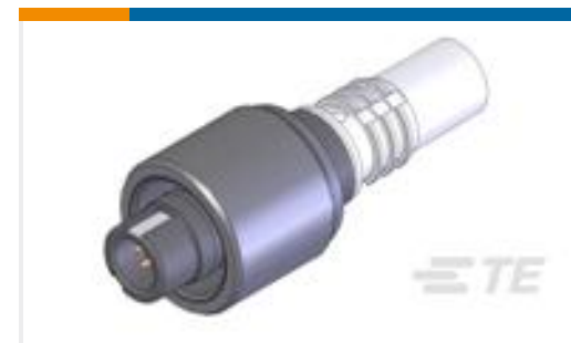
TE 产品编号2174219-1 Push-Pull 7P Plug PS S-Cup Cont KIT/N