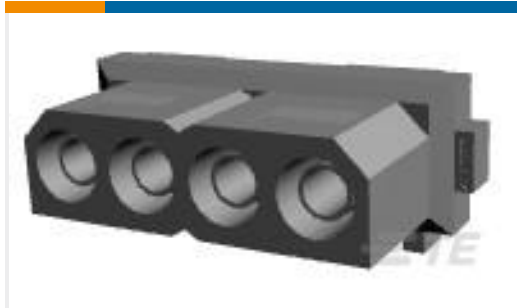
TE 产品编号770997-1 04P CMNL SOK HDR ASSY