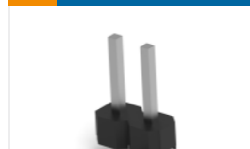
TE 产品编号2842103-2 2P,2MM,BRK HDR,SRVT,SMD,0.38AU,TR W/CAP