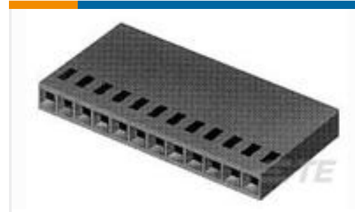
TE 产品编号87499-8 04 MODIV HSG COMP SR .100CL