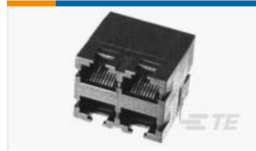
TE 产品编号2041376-2 RJ45 W LED 2X2,30u",DIP,H=25.4mm