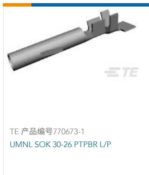
TE 产品编号770673-1 UMNL SOK 30-26 PTPBR L/P