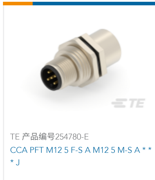
TE 产品编号254780-E CCA PFT M12 5 F-S A M12 5 M-S A ** *J