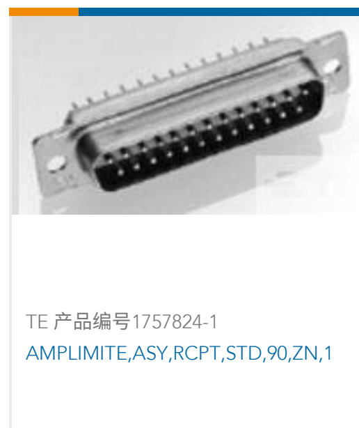
TE 产品编号1757824-1 AMPLIMITE,ASY,RCPT,STD,90,ZN,1