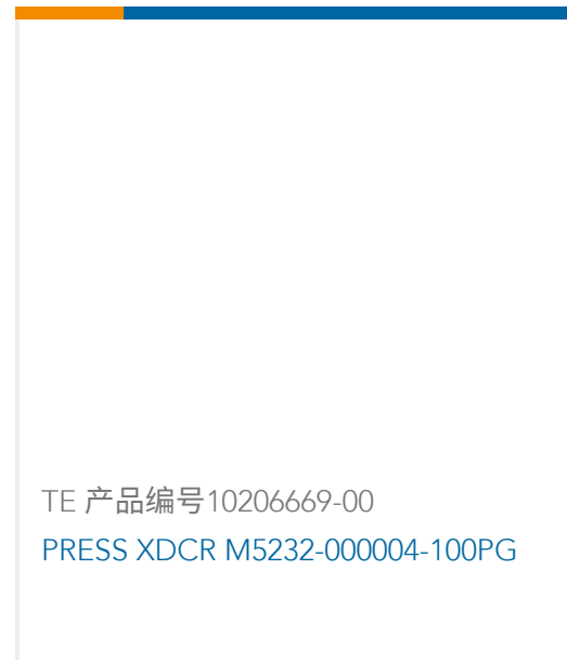
TE 产品编号10206669-00 PRESS XDCR M5232-000004-100PG