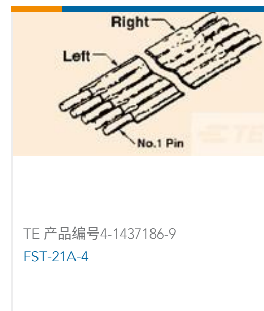
TE 产品编号4-1437186-9 FST-21A-4