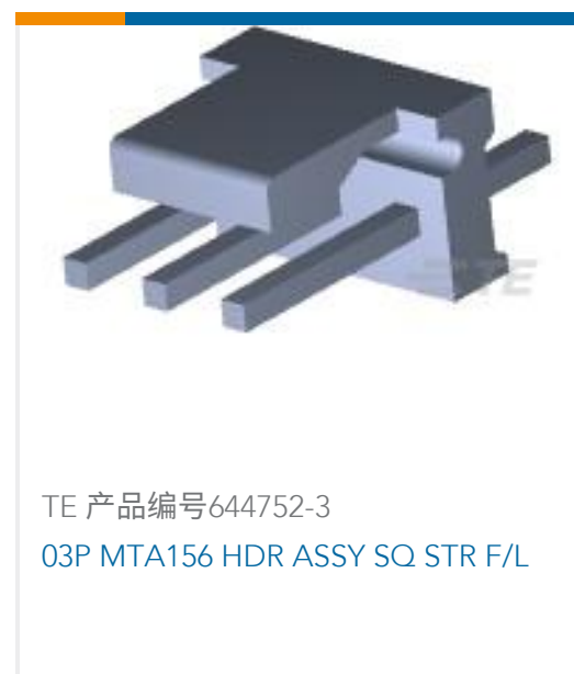
TE 产品编号644752-3 03P MTA156 HDR ASSY SQ STR F/L