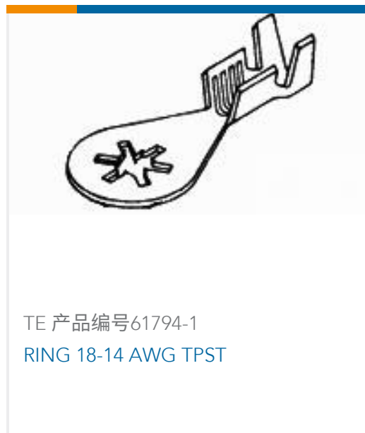
TE 产品编号61794-1 RING 18-14 AWG TPST