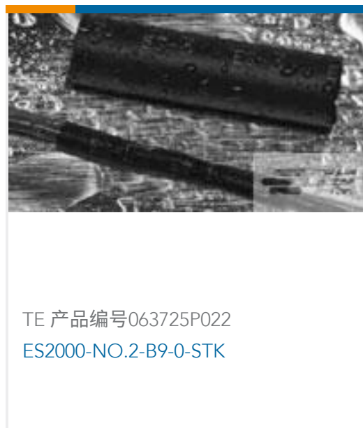
TE 产品编号063725P022 ES2000-NO.2-B9-0-STK