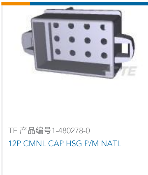
TE 产品编号1-480278-0 12P CMNL CAP HSG P/M NATL