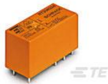
TE 产品编号 1-1415543-5 RTE44110