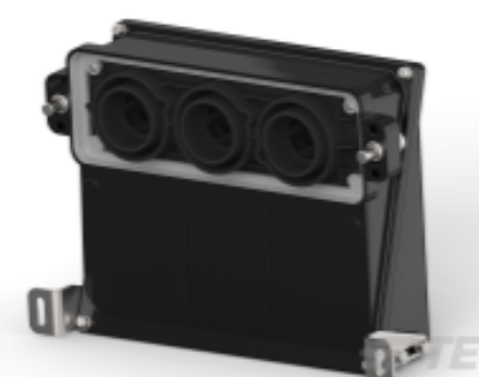
TE 产品编号 ZPF000000000205373 PLUG MALE ANG.90 CAL.20 - FXP