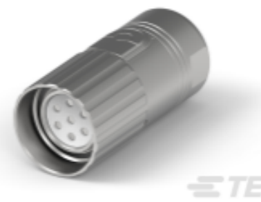
TE 产品编号 ASA158F12390235000 623 PLUG