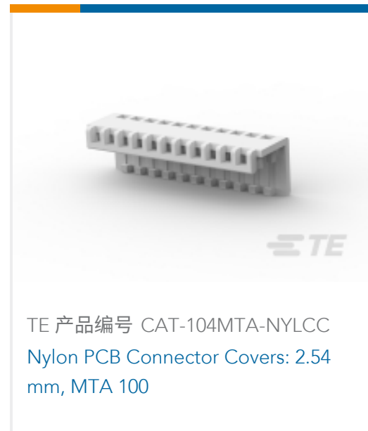
TE 产品编号 CAT-104MTA-NYLCC Nylon PCB Connector Covers: 2.54 mm, MTA 100