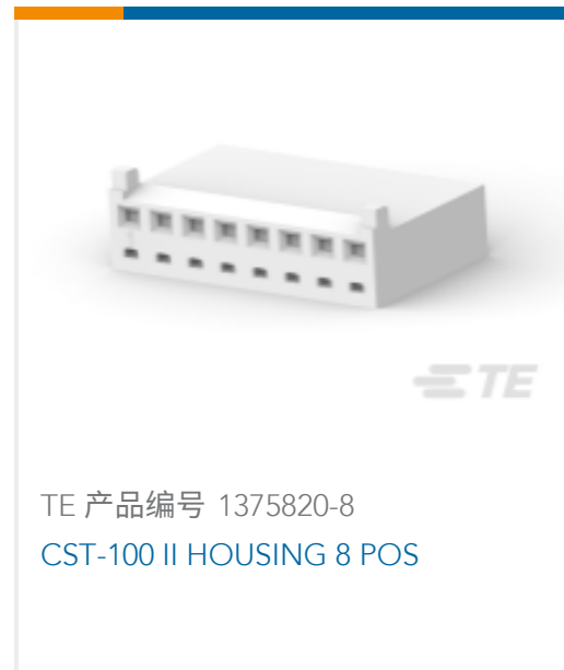
TE 产品编号 1375820-8 CST-100 II HOUSING 8 POS