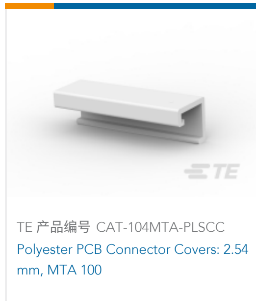
TE 产品编号 CAT-104MTA-PLSCC Polyester PCB Connector Covers: 2.54 mm, MTA 100