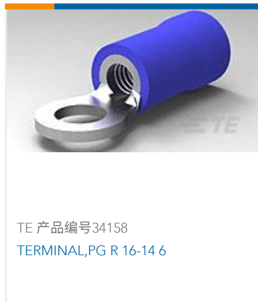
TE 产品编号34158 TERMINAL,PG R 16-14 6