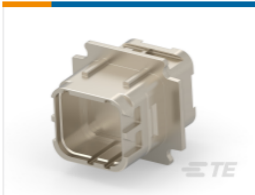
TE 产品编号ZPF00000000146309 Rectangular Connector Receptacle Extenders, Tool-less Assembly