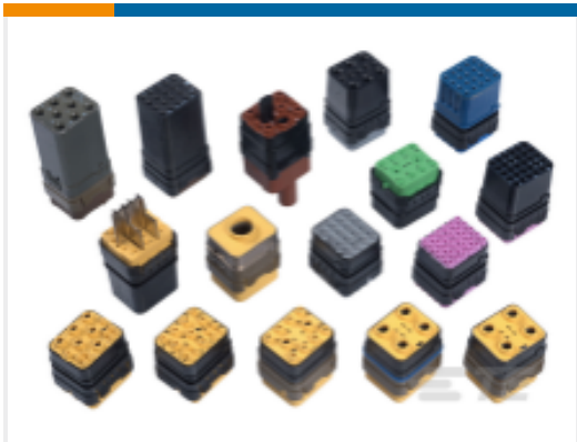
TE 产品编号ZPF00000000148762 DMC-M 99-04 AN (=33537-P0000)