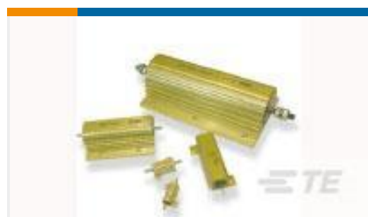
TE 产品编号3-1625999-7 HSC100 4K7 5%